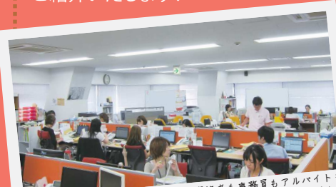
丸の内事務所の様子 代表も資格者も事務員もアルバイトも同じフロアで風通しの良い社内です。

司法書士は、国家試験を経て、司法書士会に登録することで業務を行うことができる、法律の専門家です。